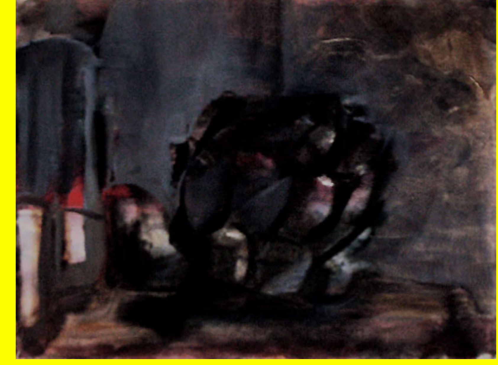
Adrian Williams, Untitled (Artichoke), 2008