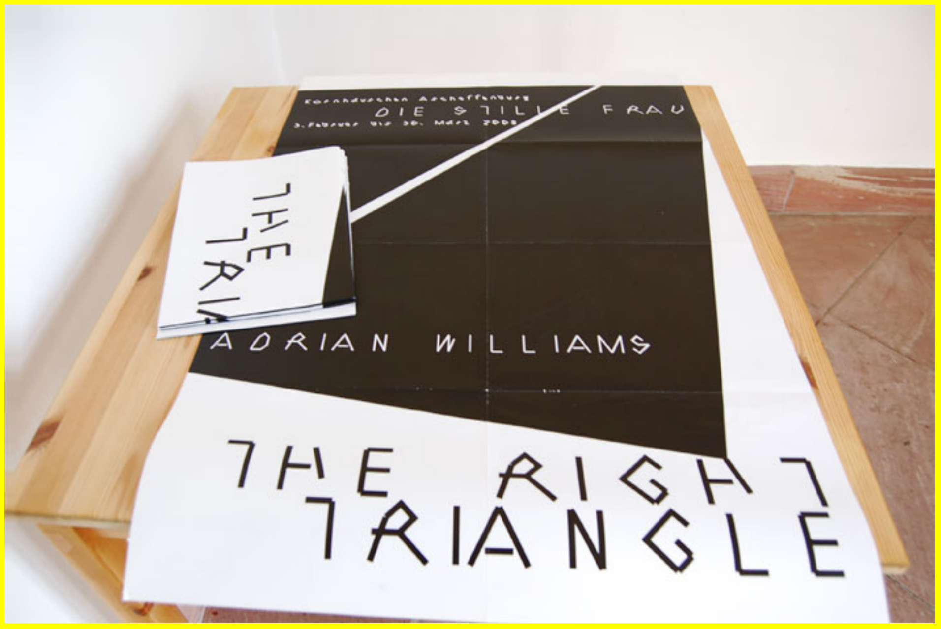
Adrian Williams, The Right Triangle, 2008